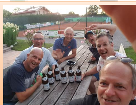
Herren 40 😊 nach dem 4:5