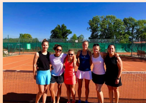
Nach 2:4 nach den Einzeln holen die Damen alle drei Doppel und gewinnen am Ende mit 5:4 gg Otterfing.